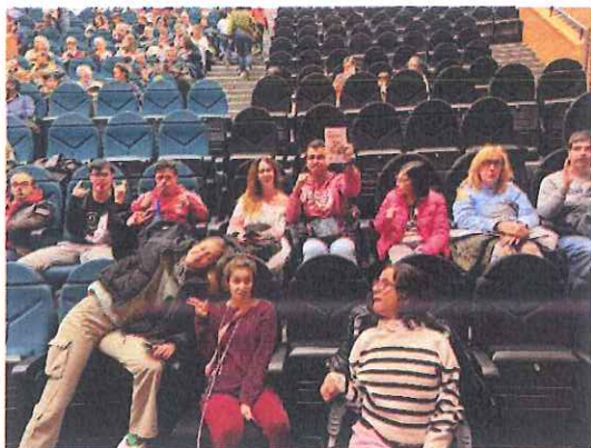
En el Pilar Bardem, escuchando a la Sinfónica de Rivas