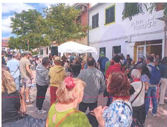
En la 'Casa Fundar', dentro de las Fiestas de #Rivas , un concierto a cargo de Topper Chopper R&R Band , miembros de la banda de HorAs.

A la vez pudimos disfrutar de una rica paella que compartimos con nuestros usuarios, familias y vecinos que vinieron a visitarnos.