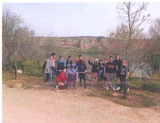
Excursión por Laguna del Campillo