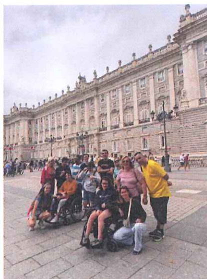
Excursión al centro de Madrid